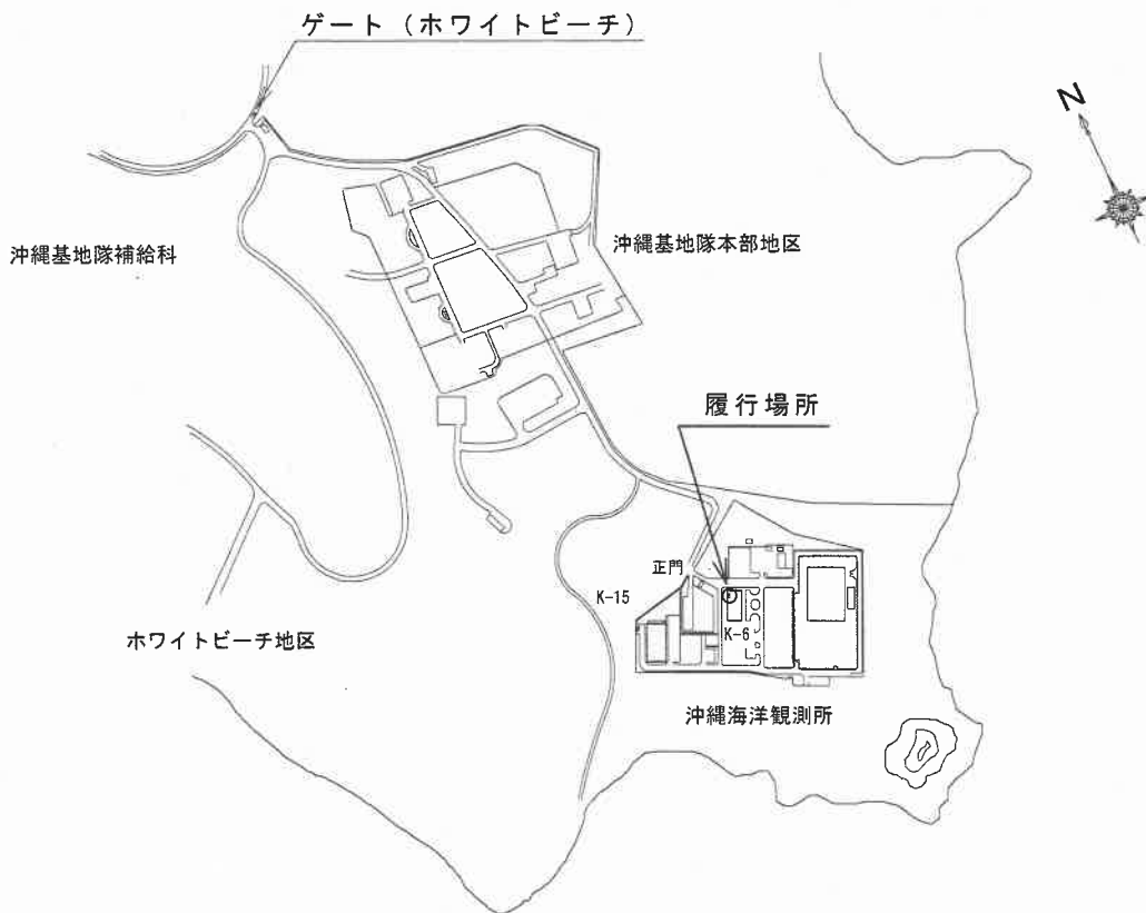
沖縄海洋観測所配置図 NO SCALE