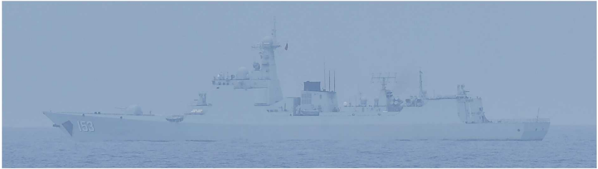
ルーランⅡ級ミサイル駆逐艦（艦番号「153」）