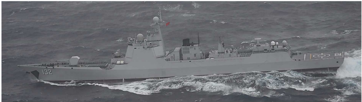
ルーヤンⅢ級ミサイル駆逐艦（艦番号「132」）