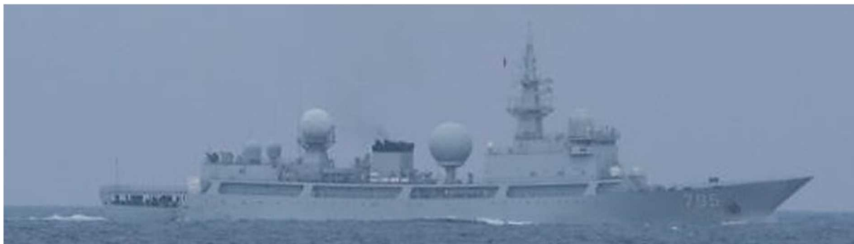
ドンディアオ級情報収集艦（艦番号「795」）