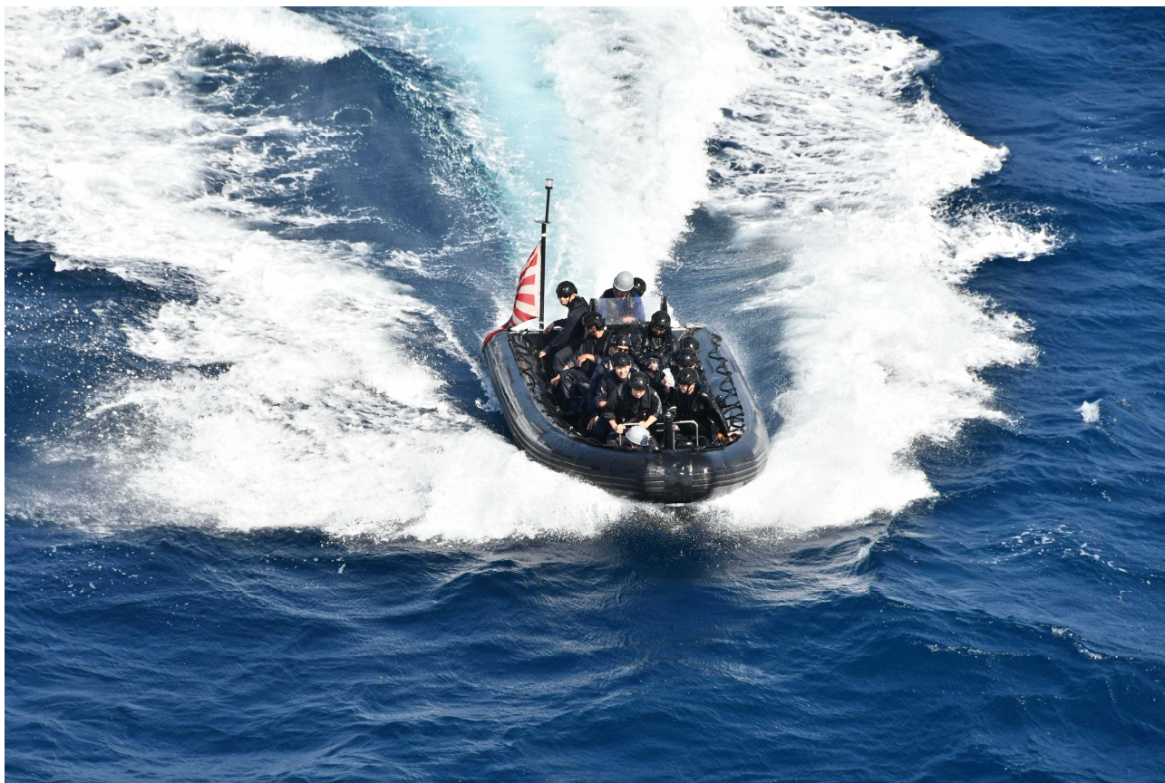
海賊対処訓練の様子