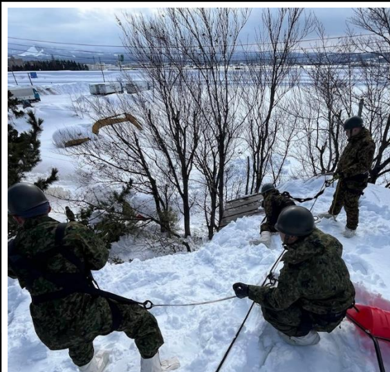
安全管理しながらの作業