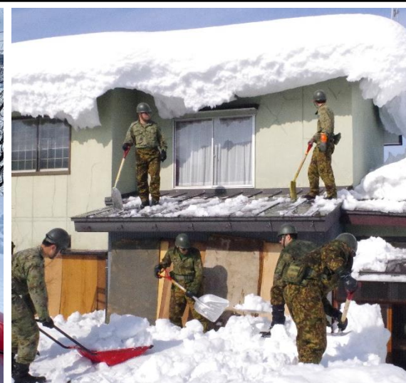
屋根の除排雪を実施する様子