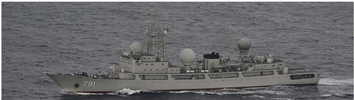
ドンディアオ級情報収集艦（艦番号「791」）