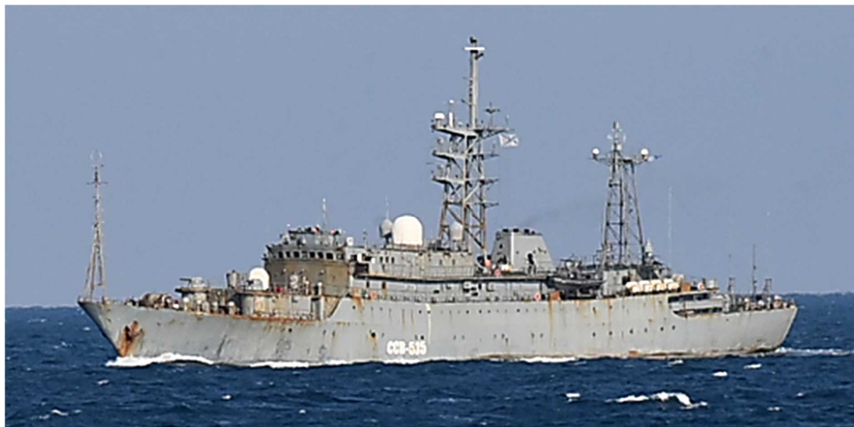
ヴィシニャ級情報収集艦（艦番号「535」）