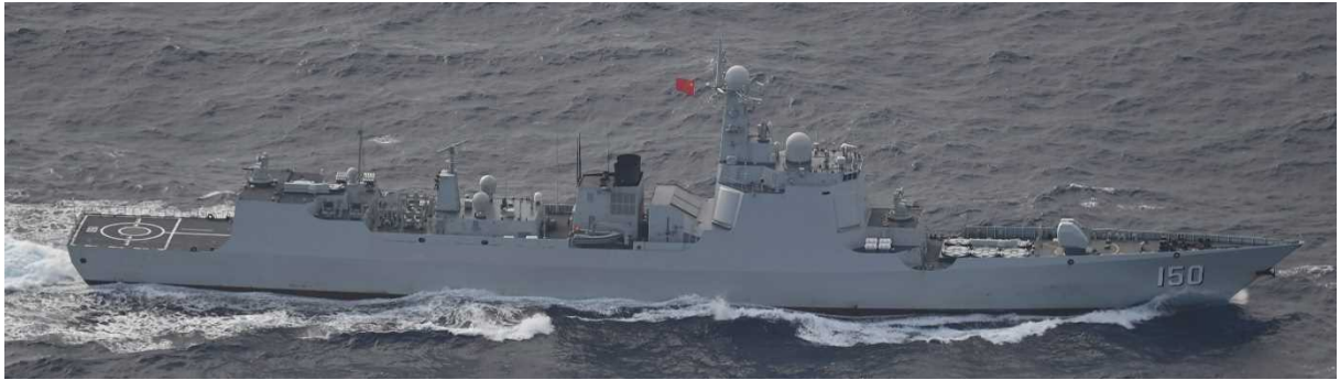
ルーランⅡ級ミサイル駆逐艦（艦番号「150」）