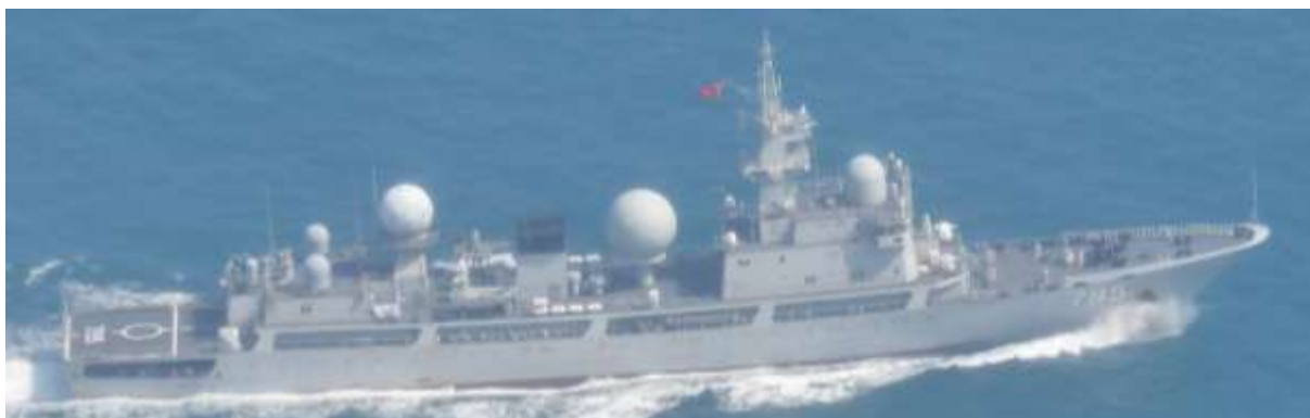
ドンディアオ級情報収集艦（艦番号「795」）