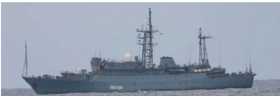
ヴィンニャ級情報収集艦 (艦番号「535」)