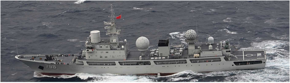
ドンディアオ級情報収集艦（艦番号「798」）