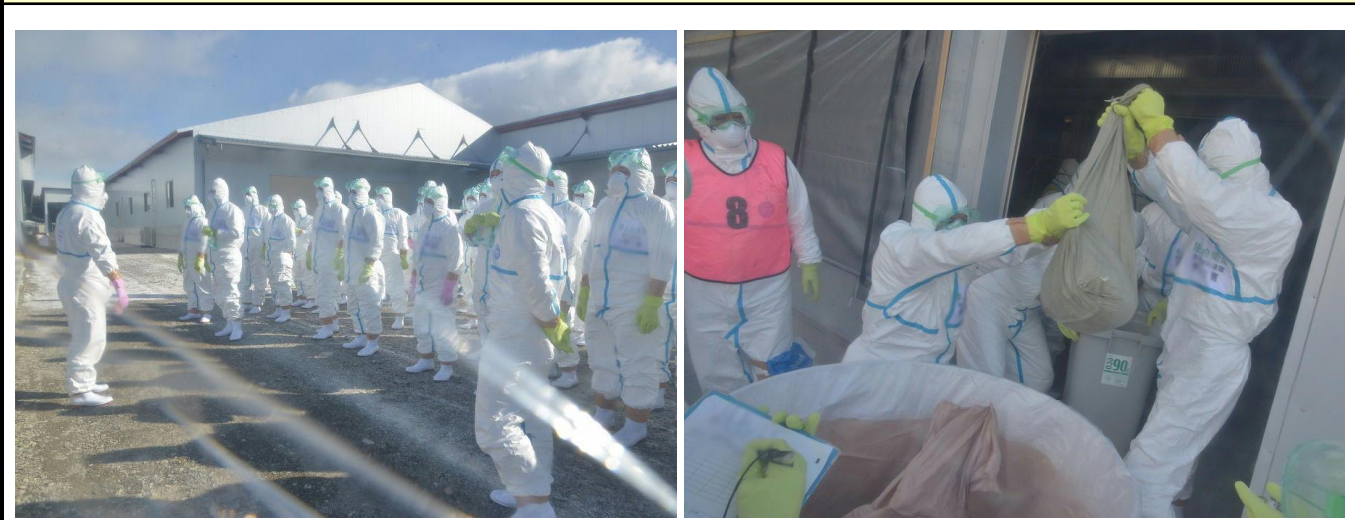
【参考】群馬県吾妻郡における災害派遣 (令和5年12月31日～令和6年1月3日)