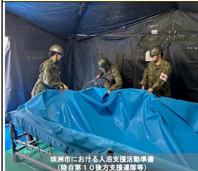
珠洲市における入浴支援活動準備 (陸自第10後方支援連隊等)