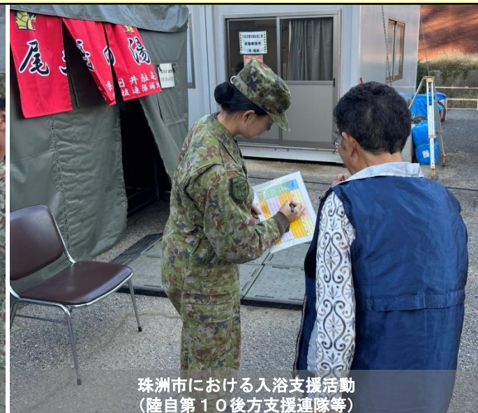
珠洲市における入浴支援活動 (陸自第10後方支援連隊等)