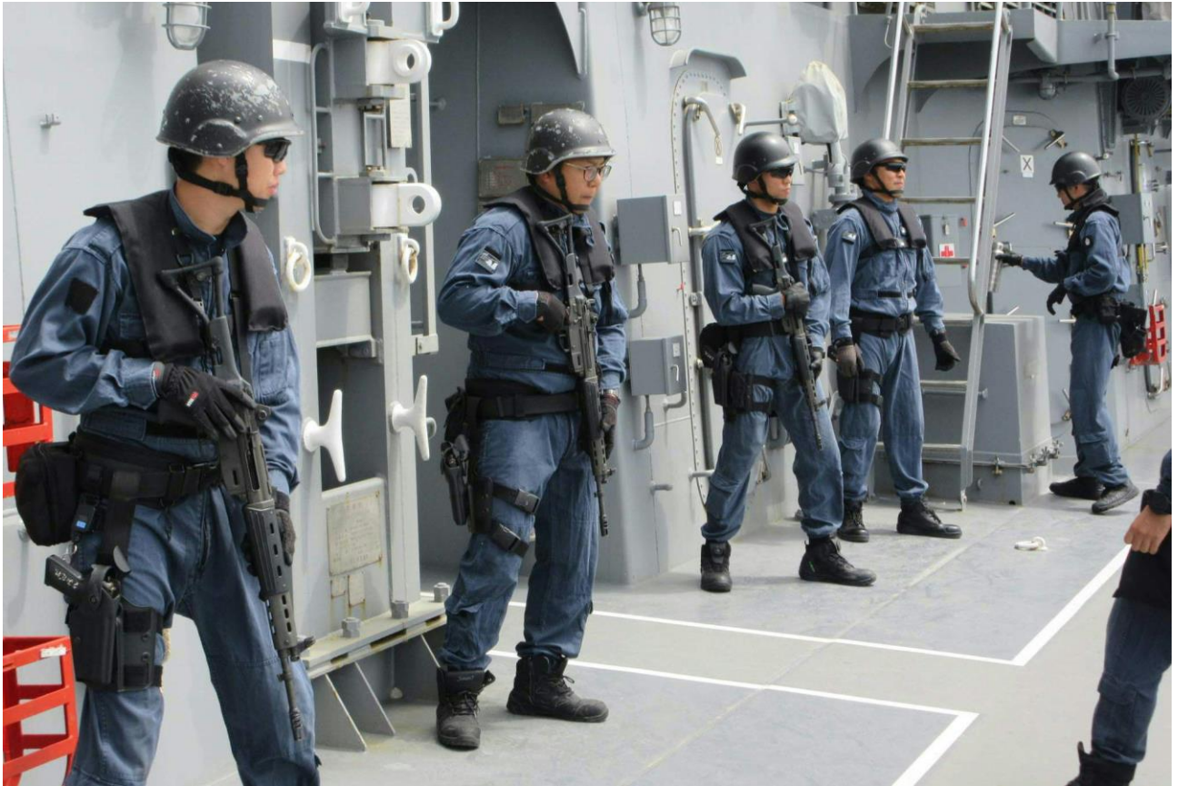
海賊対処訓練の様子