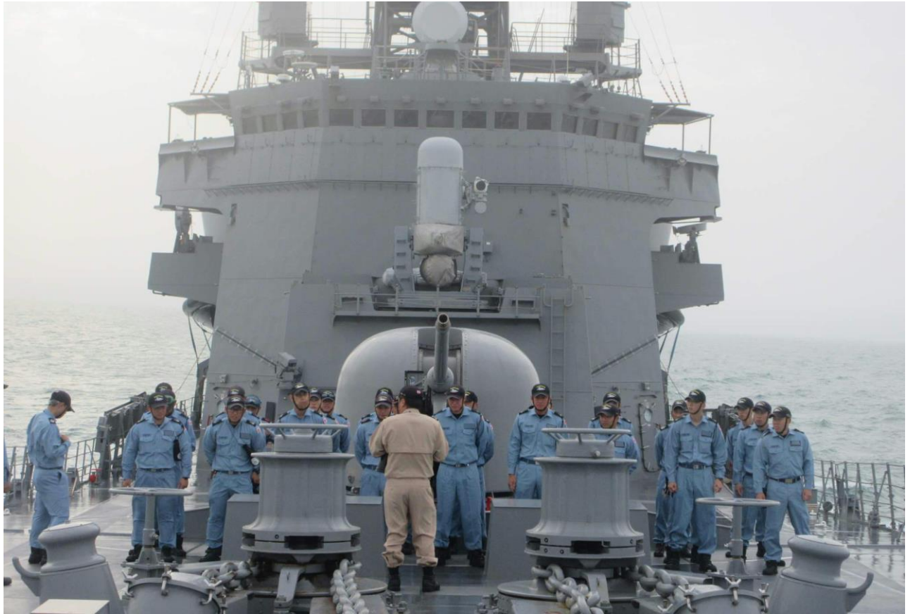
任務に従事する「さみだれ」隊員