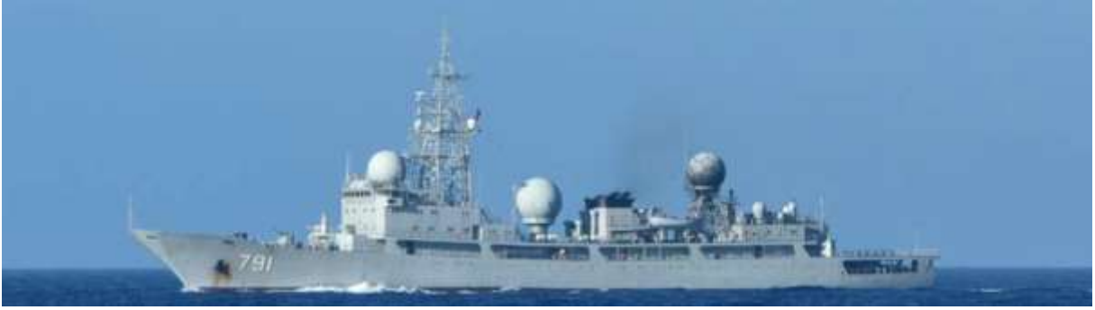
ドンディアオ級情報収集艦（艦番号「791」）