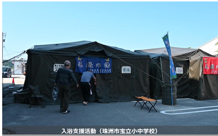
入浴支援活動（珠洲市宝立小中学校）