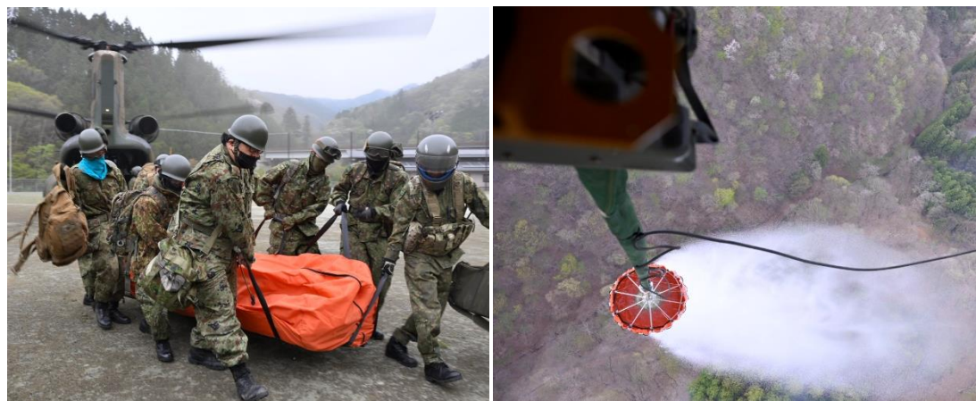
群馬県上野村における空中消火活動準備及び空中消火の様子 (令和6年4月21日 第12ヘリコプター隊(相馬原))