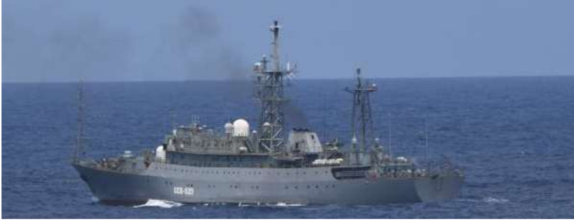
ヴィンニャ級情報収集艦（艦番号「535」）