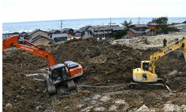
関係機関と連携した土砂崩れによる行方不明者捜索