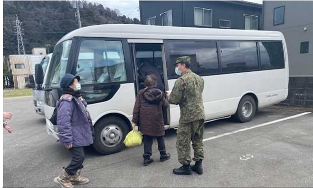
「はくおう」への送迎の様子