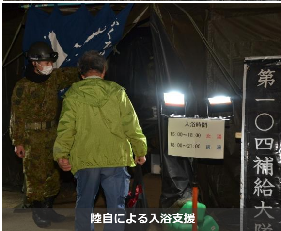
陸自による入浴支援