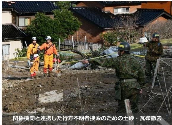
関係機関と連携した行方不明者捜索のための土砂・瓦礫撤去