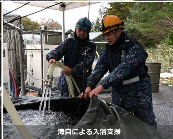
海自による入浴支援