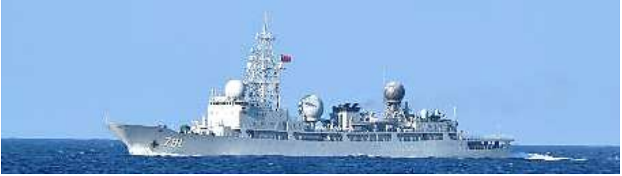
ドンディアオ級情報収集艦（艦番号「791」）