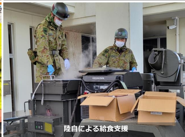
陸自による給食支援