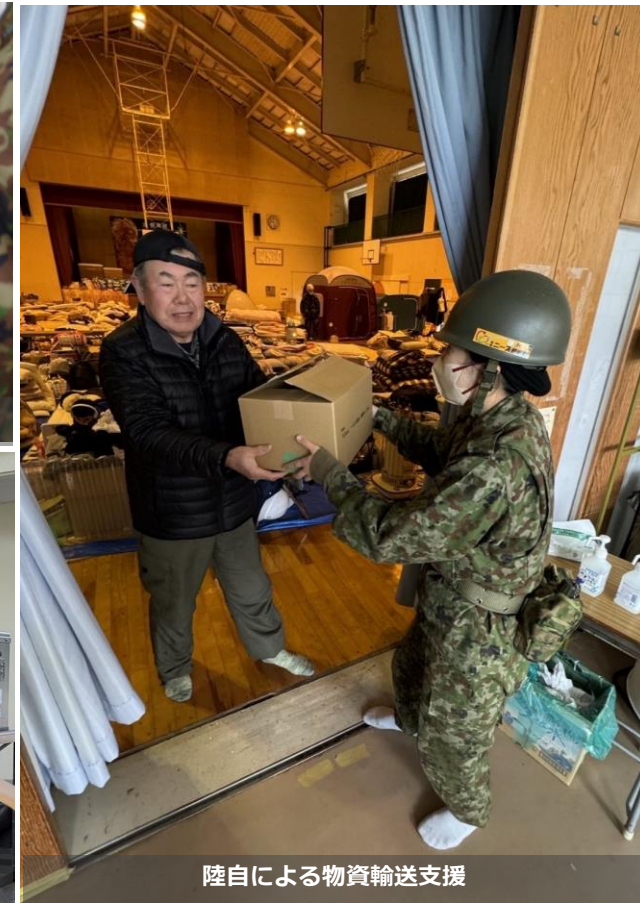
陸自による物資輸送支援