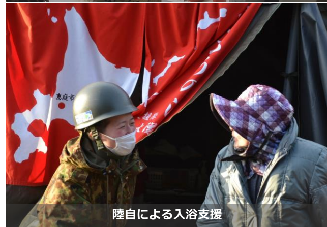
陸自による入浴支援