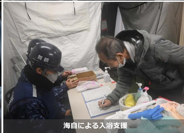
海自による入浴支援