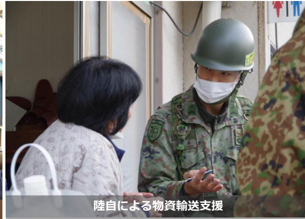
陸自による物資輸送支援