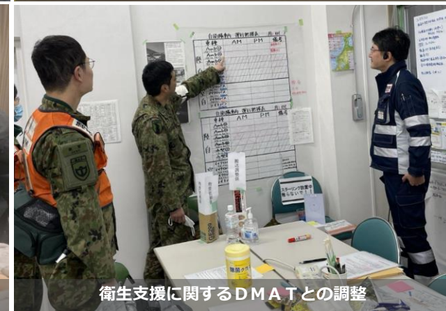
衛生支援に関するDMATとの調整