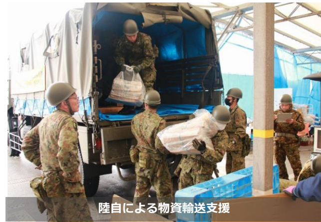
陸自による物資輸送支援