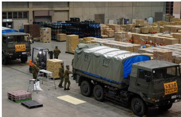
陸自による物資輸送支援