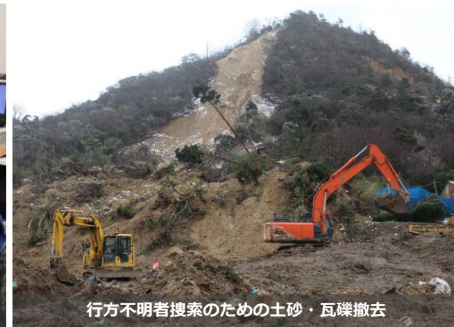
行方不明者捜索のための土砂・瓦礫撤去