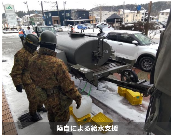
陸自による給水支援