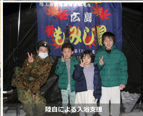
陸自による入浴支援