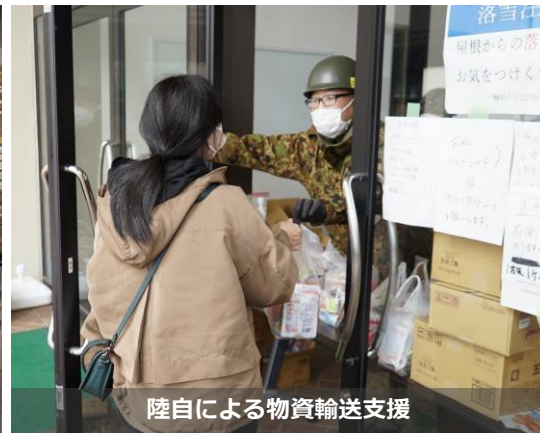
陸自による物資輸送支援