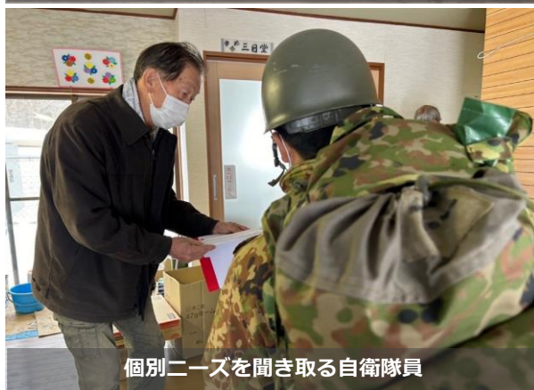
個別ニーズを聞き取る自衛隊員