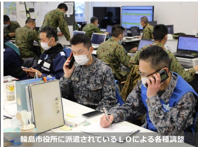
輪島市役所に派遣されているL0による各種調整