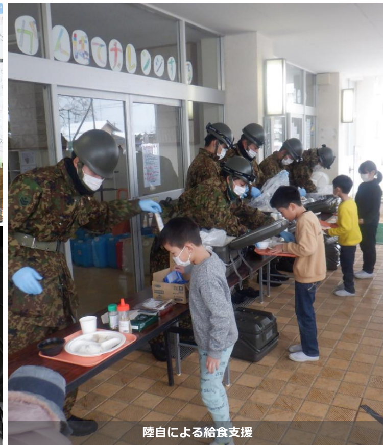
陸自による給食支援