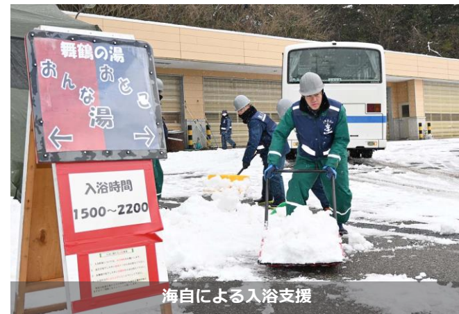
海自による入浴支援