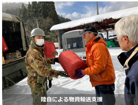
陸自による物資輸送支援