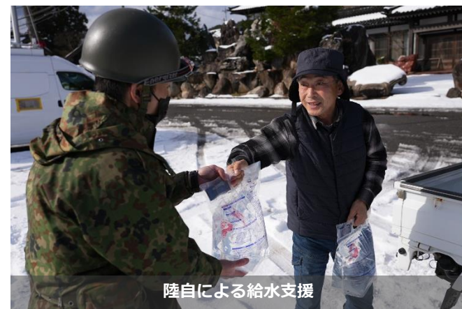
陸自による給水支援