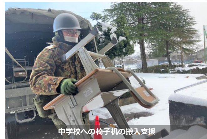
中学校への椅子機の搬入支援