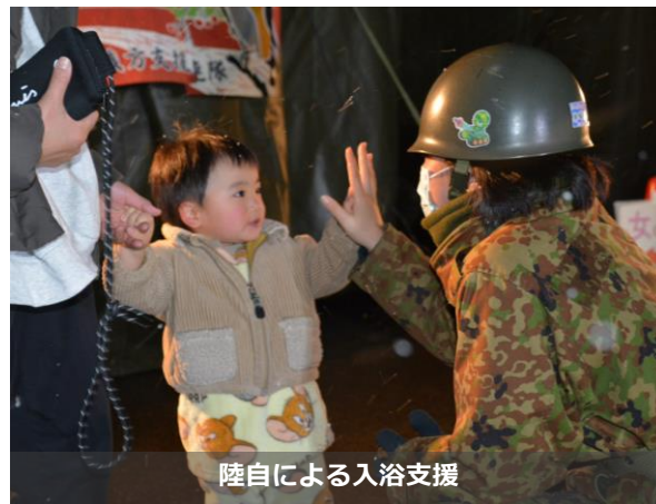
陸自による入浴支援