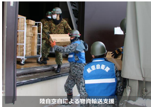
陸自空自による物資輸送支援