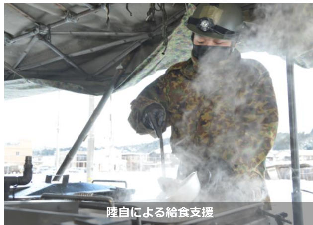
陸自による給食支援