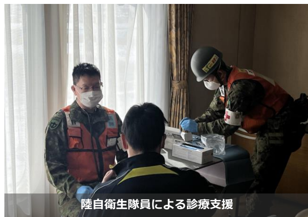
陸自衛生隊員による診療支援