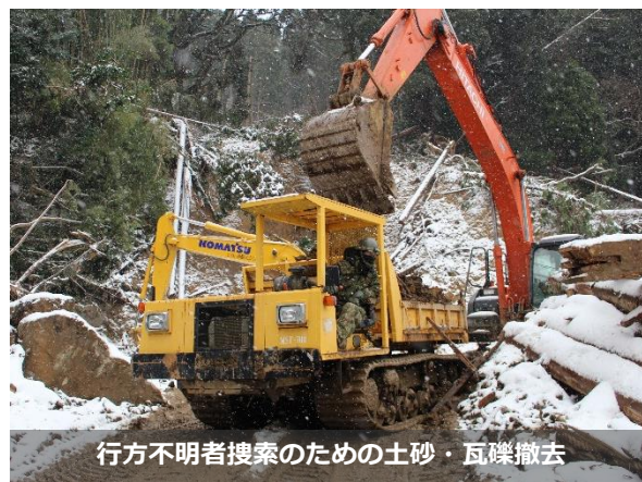
行方不明者捜索のための土砂・瓦礫撤去