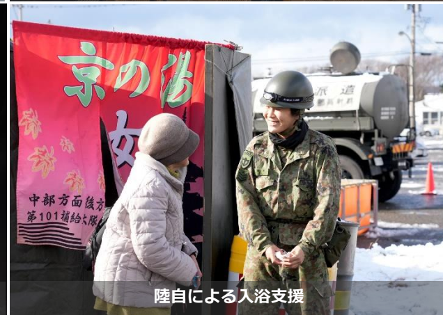
陸自による入浴支援