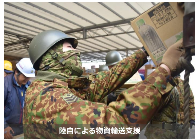
陸自による物資輸送支援