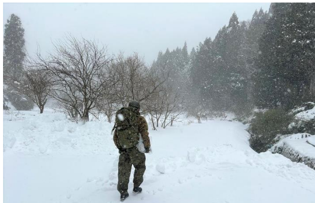
陸自隊員による物資輸送支援