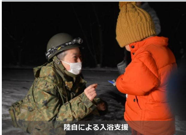
陸自による入浴支援