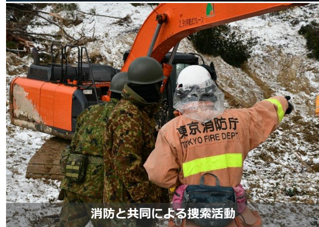
消防と共同による捜索活動