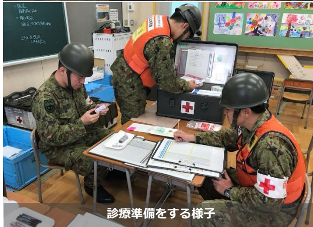
診療準備をする様子