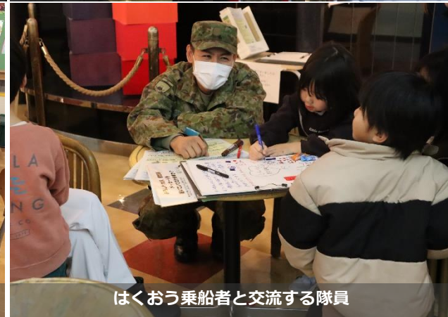
はくおう乗船者と交流する隊員