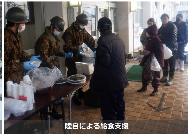
陸自による給食支援