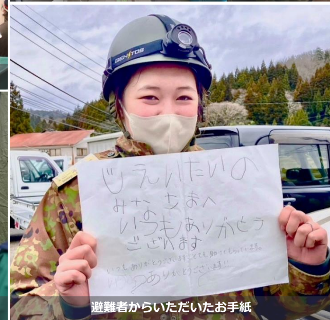
避難者からいただいたお手紙