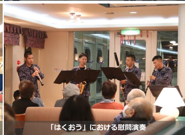
「はくおう」における慰問演奏