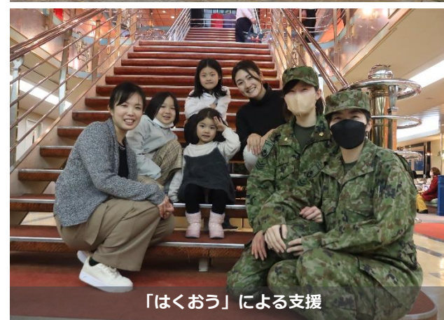
「はくおう」による支援