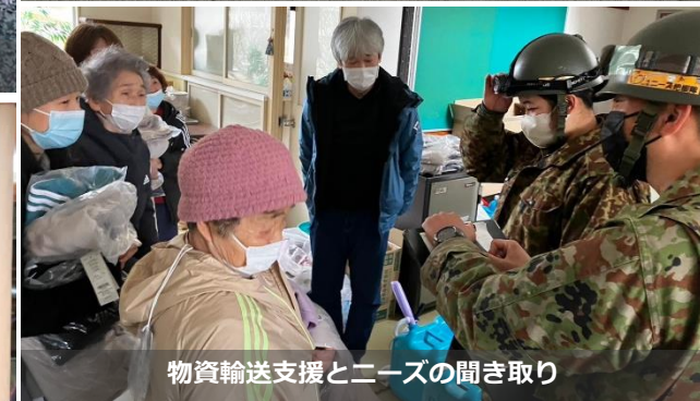
物資輸送支援とニーズの聞き取り