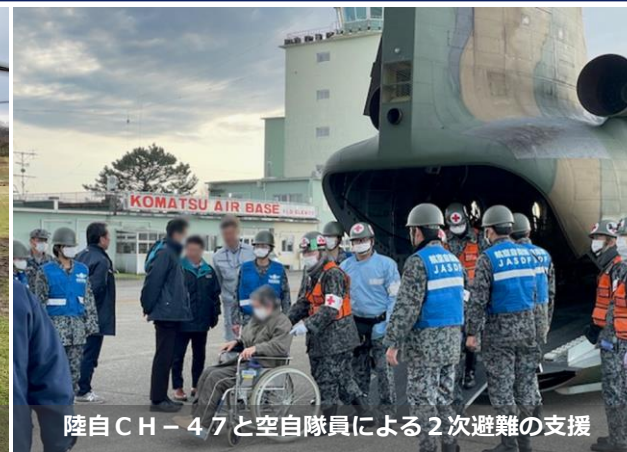
陸自CH-47と空自隊員による2次避難の支援