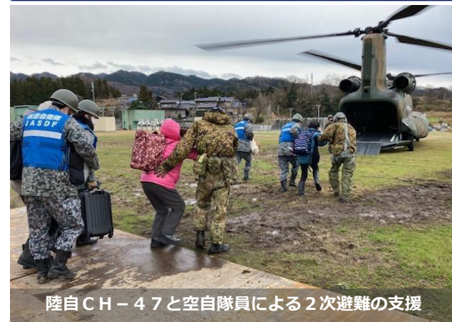
陸自CH-47と空自隊員による2次避難の支援