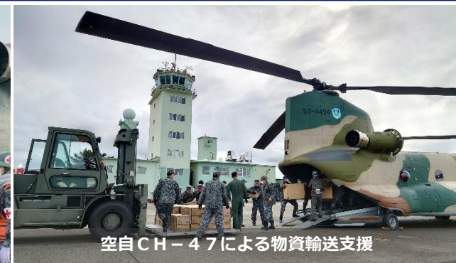
空自CH-47による物資輸送支援