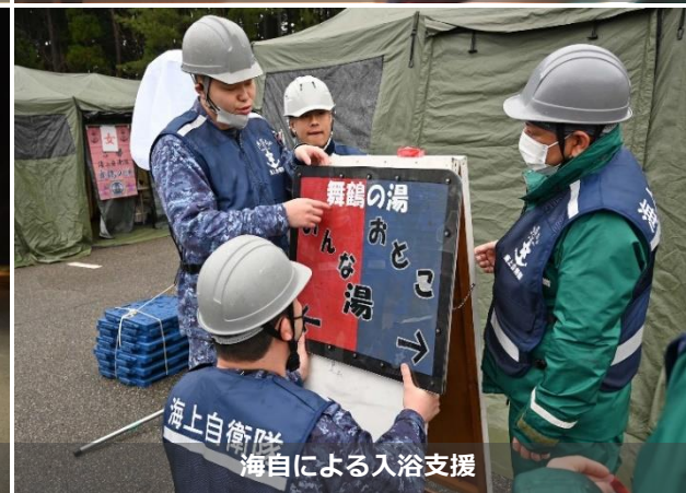
海自による入浴支援