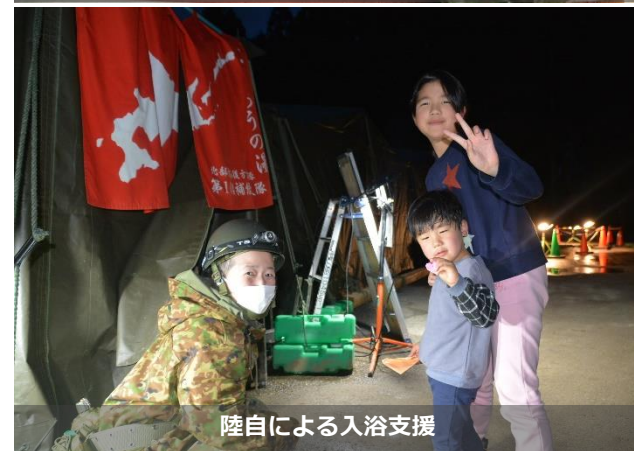
陸自による入浴支援