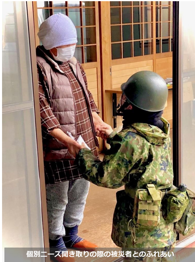
個別ニーズ聞き取りの際の被災者とのふれあい