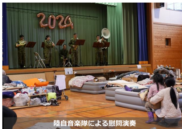
陸自音楽隊による慰問演奏