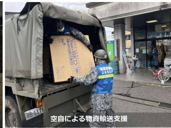
空自による物資輸送支援