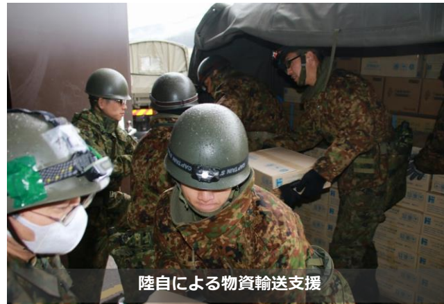
陸自による物資輸送支援