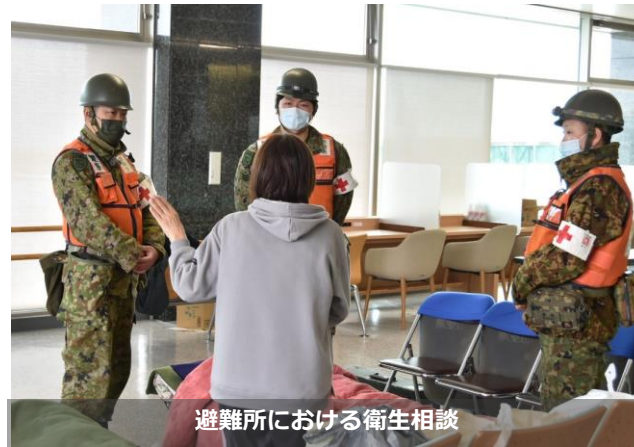
避難所における衛生相談