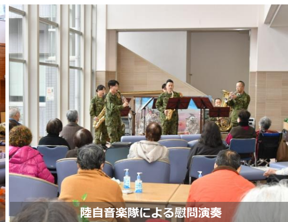
陸自音楽隊による慰問演奏