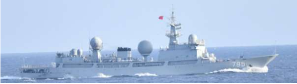
ドンディアオ級情報収集艦（艦番号「795」）