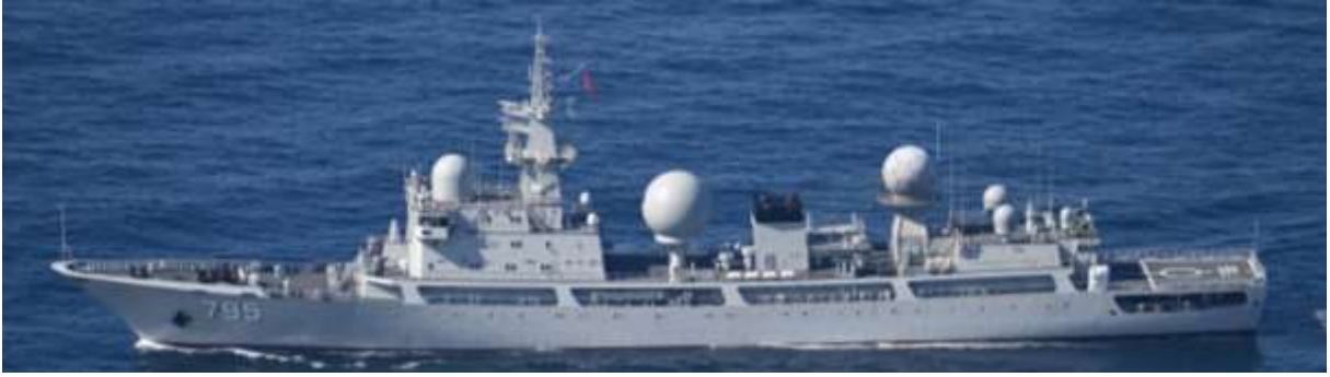
ドンディアオ級情報収集艦（艦番号「795」）