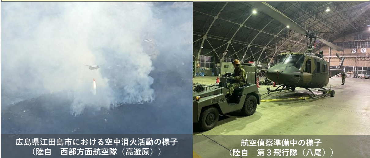
広島県江田島市における空中消火活動の様子 (陸自 西部方面航空隊(高遊原))