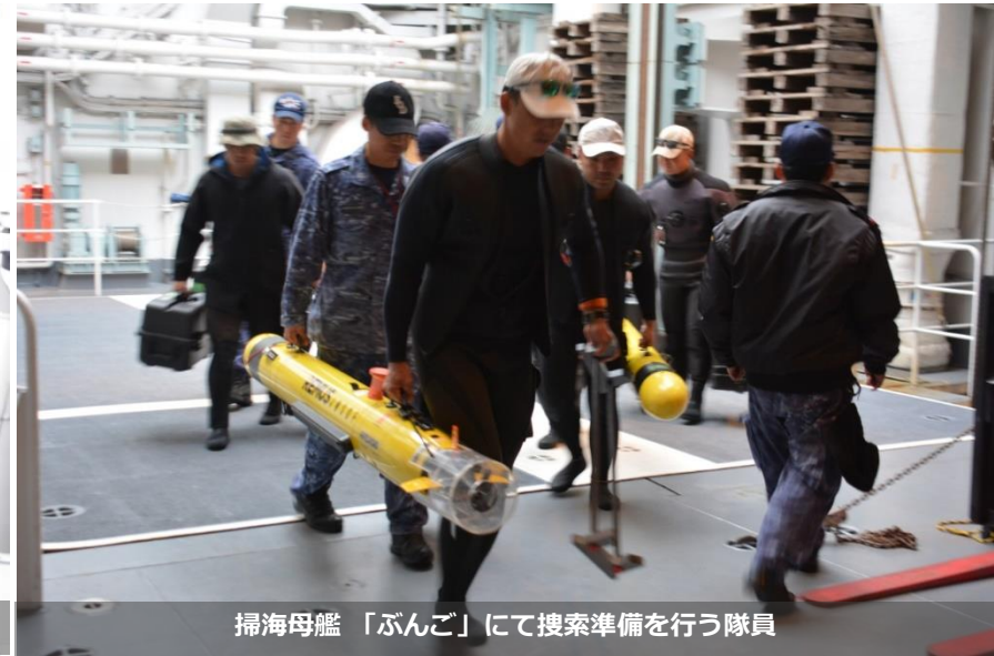
掃海母艦「ぶんご」にて捜索準備を行う隊員