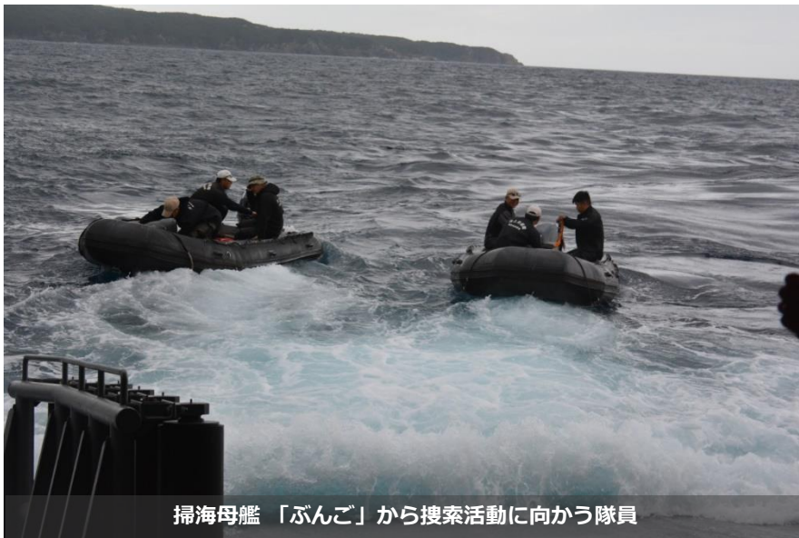
掃海母艦「ぶんご」から捜索活動に向かう隊員