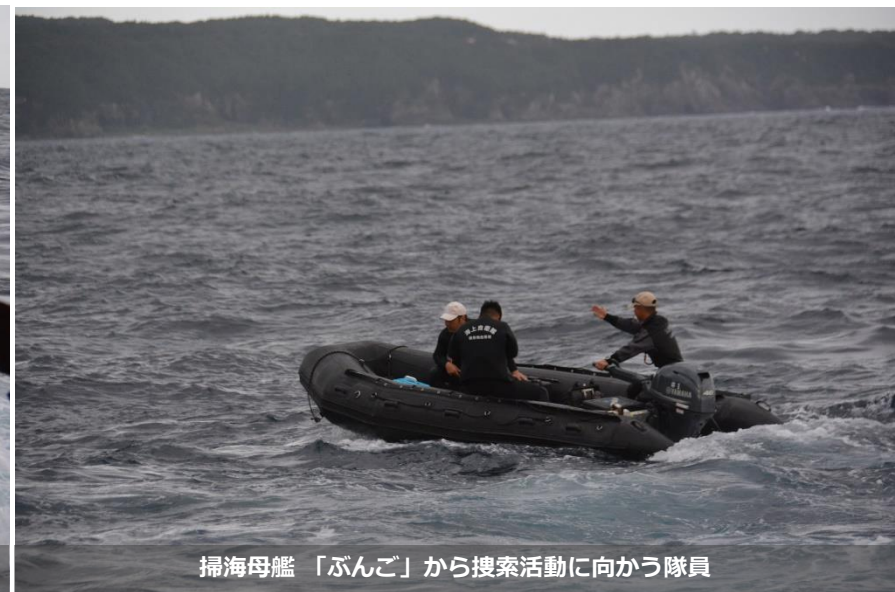
掃海母艦「ぶんご」から捜索活動に向かう隊員