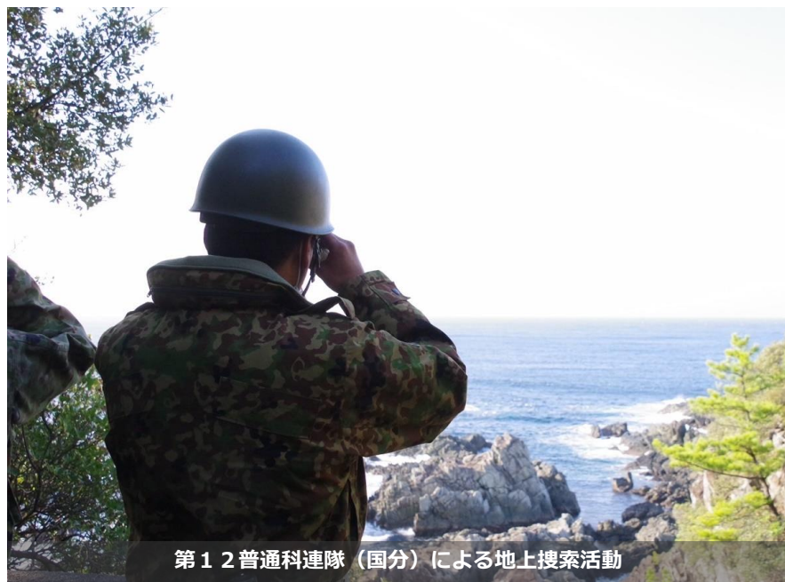
第12普通科連隊（国分）による地上搜索活動