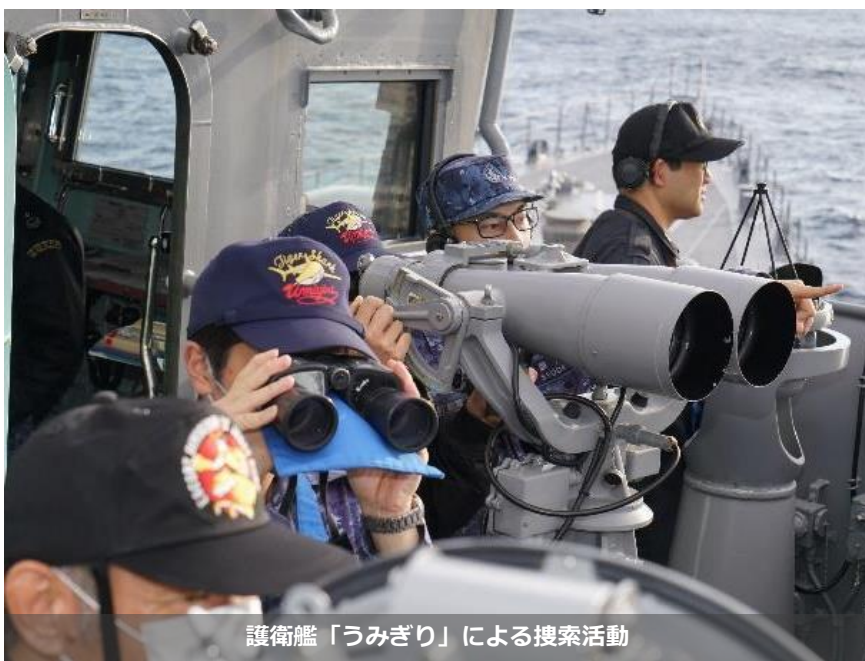
護衛艦「うみぎり」による搜索活動