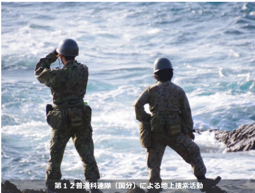
第12普通科連隊（国分）による地上搜索活動