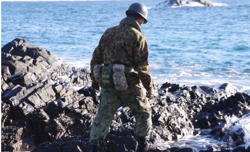
第12普通科連隊（国分）による地上搜索活動