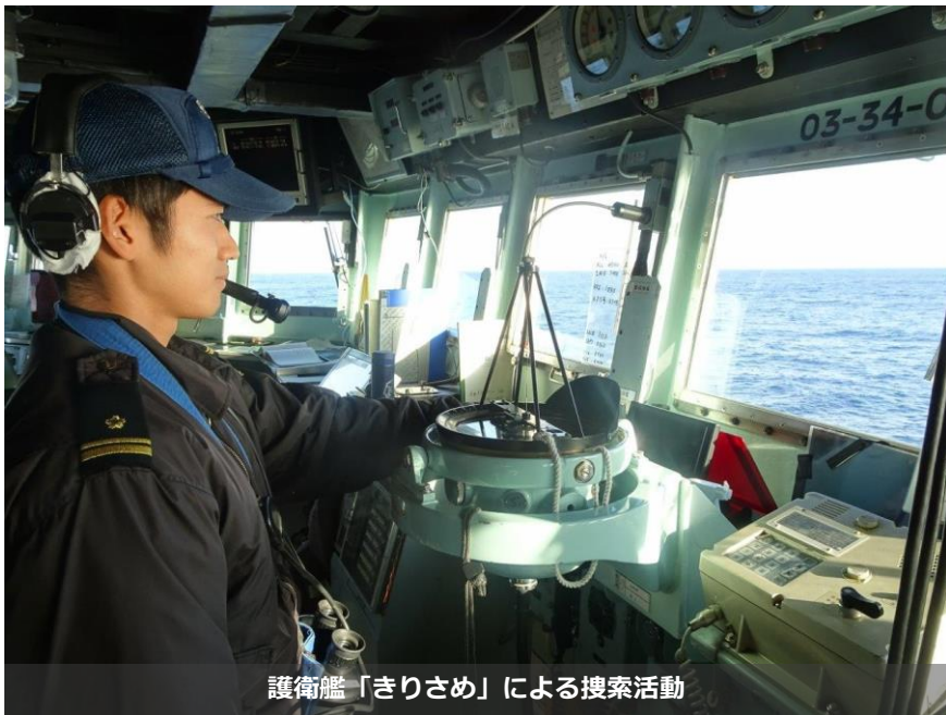
護衛艦「きりさめ」による搜索活動