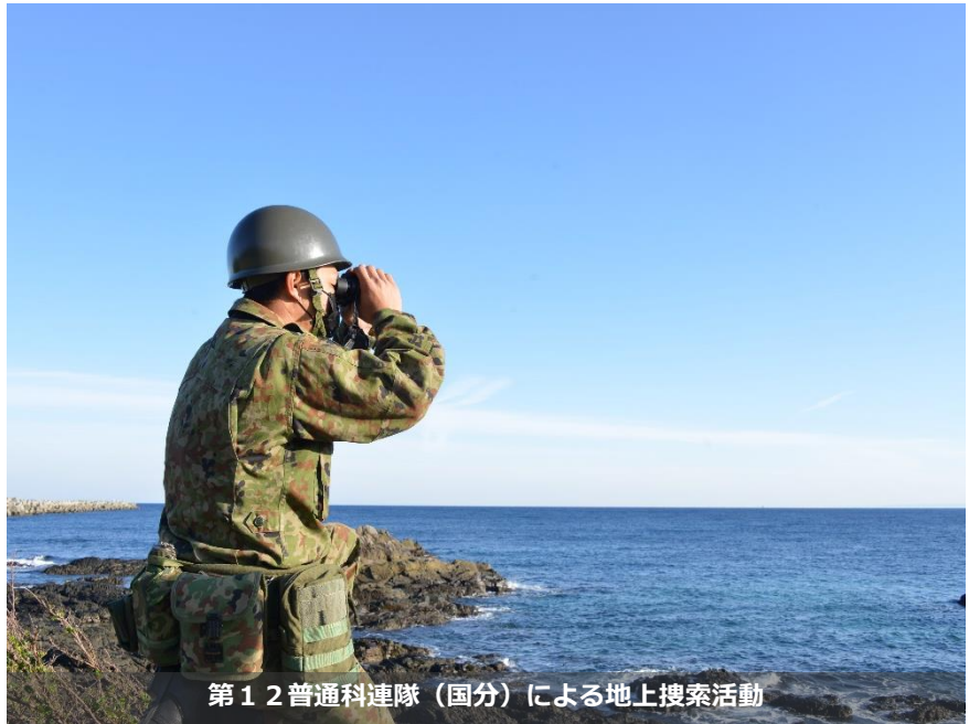
第12普通科連隊（国分）による地上搜索活動