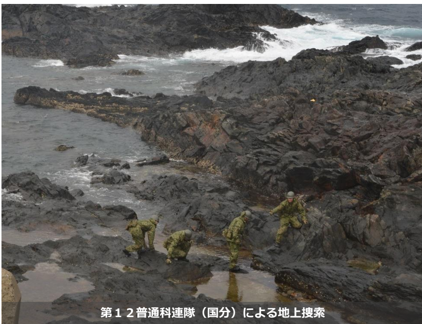
第12普通科連隊(国分)による地上搜索