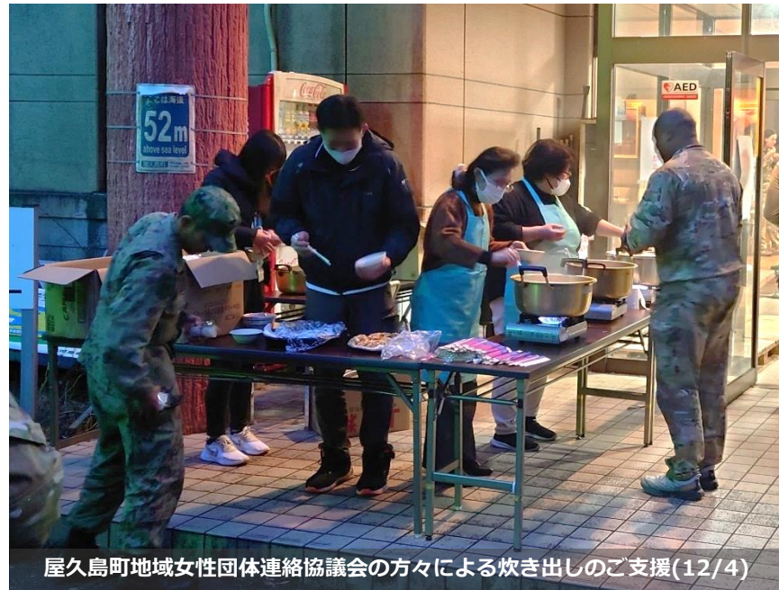
屋久島町地域女性団体連絡協議会の方々による炊き出しのご支援(12/4)