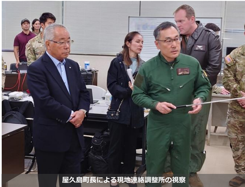
屋久島町長による現地連絡調整所の視察