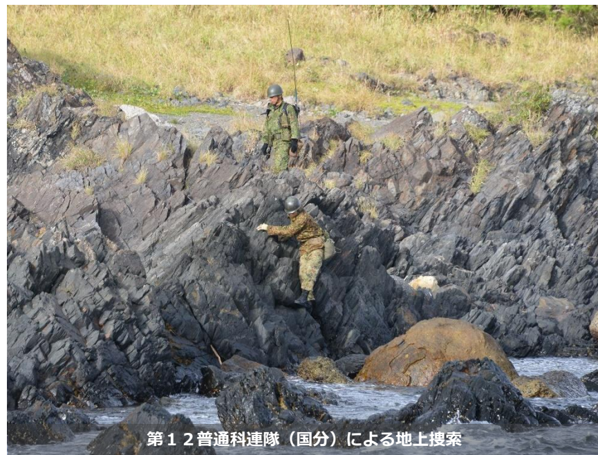
第12普通科連隊(国分)による地上搜索