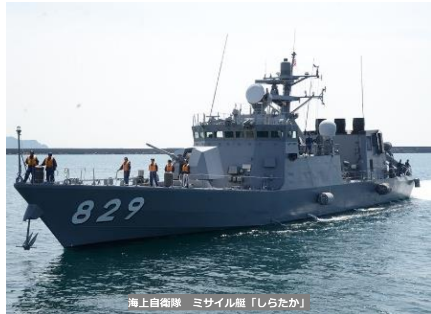
海上自衛隊 ミサイル艇「しらたか」