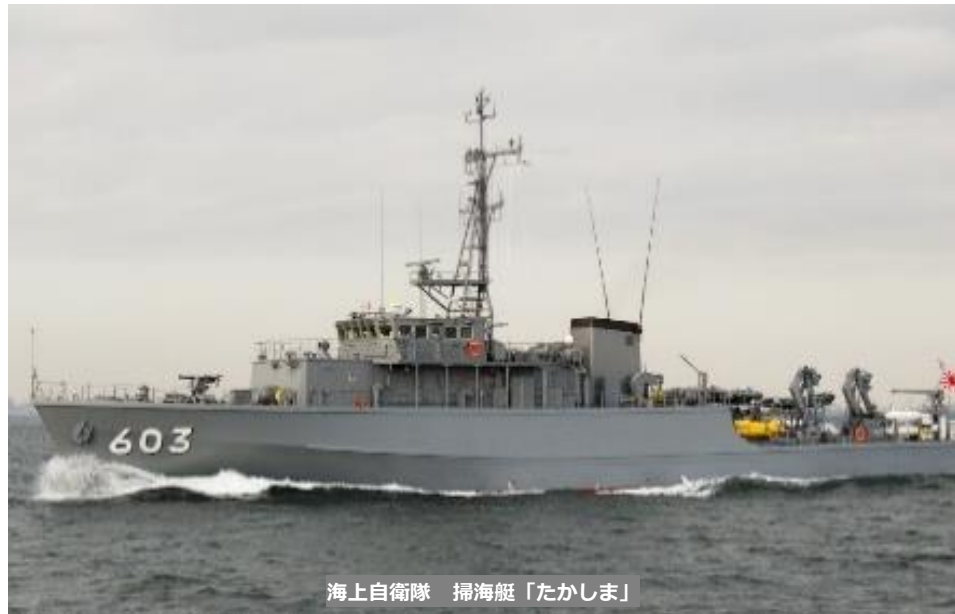
海上自衛隊 掃海艇「たかしま」