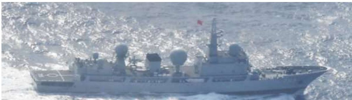
ドンディアオ級情報収集艦（艦番号「795」）