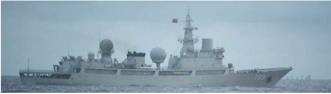
ドンディアオ級情報収集艦（艦番号「799」）