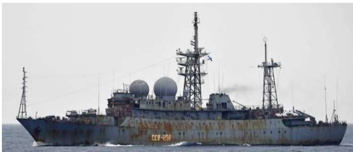
ヴィンニャ級情報収集艦（艦番号「208」）