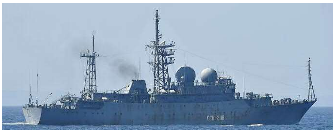
ヴィンニャ級情報収集艦（艦番号「208」）