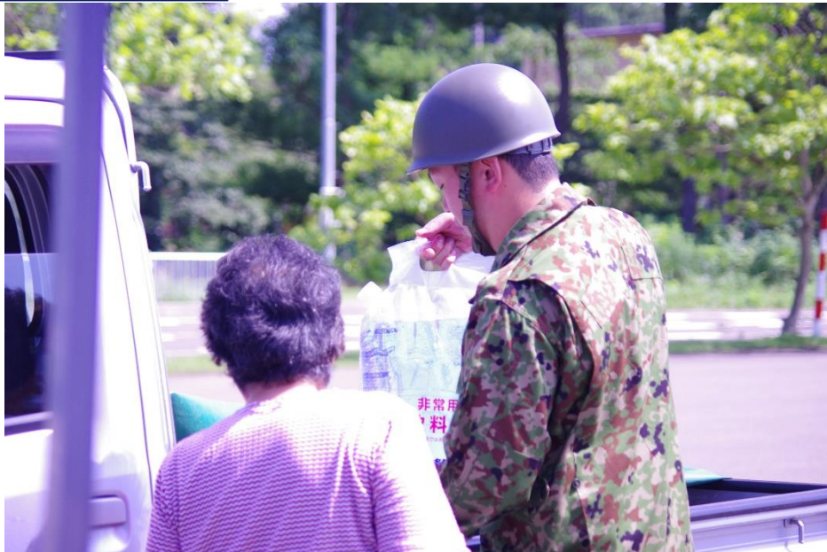
給水支援の様子（八峰町）