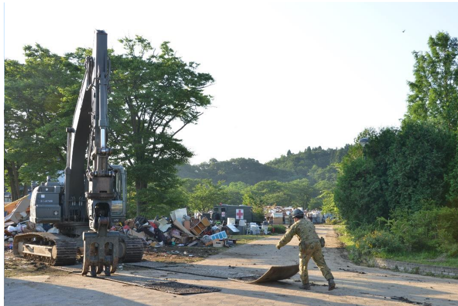
災害廃棄物の撤去（秋田市）