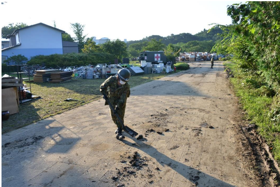
災害廃棄物の撤去【搬出口の整備】（秋田市）