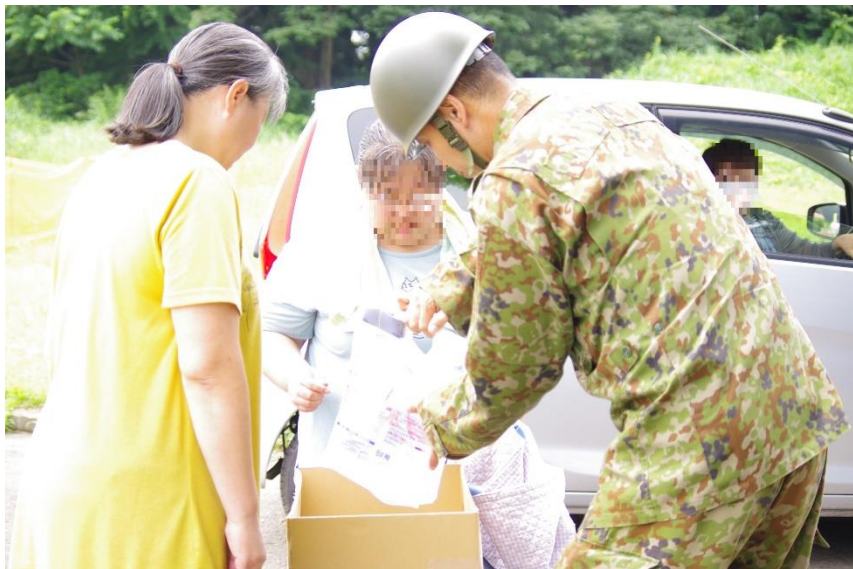
給水支援の様子（八峰町） 【陸自第21普通科連隊（秋田）】