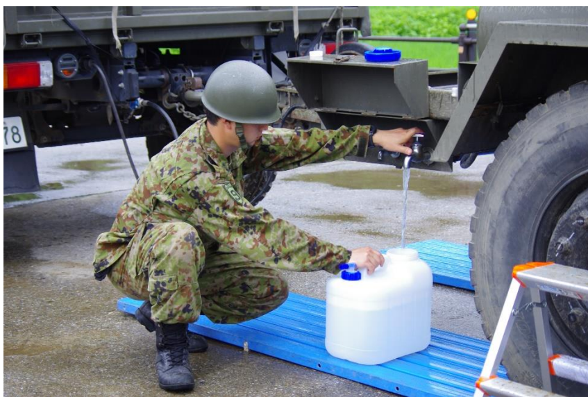
給水支援の様子（五城目町） 【陸自第21普通科連隊（秋田）】