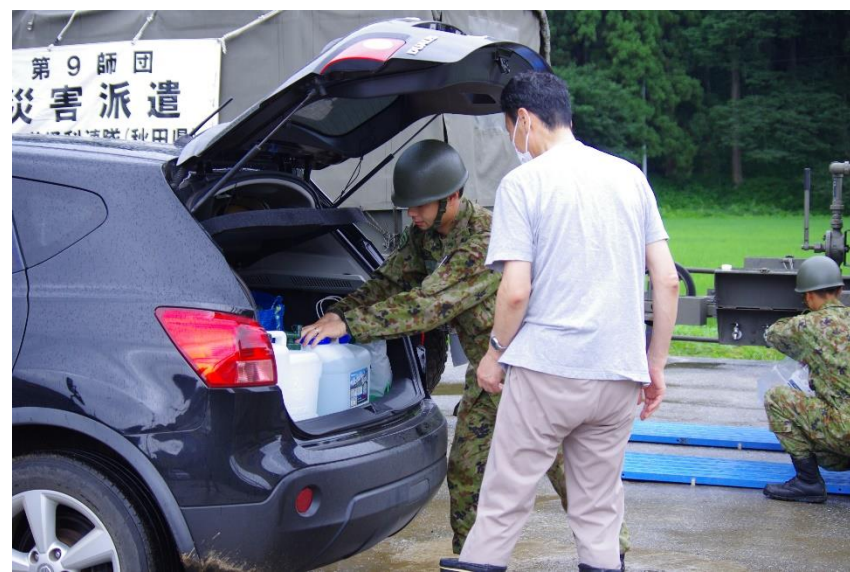
給水支援の様子（五城目町） 【陸自第21普通科連隊（秋田）】