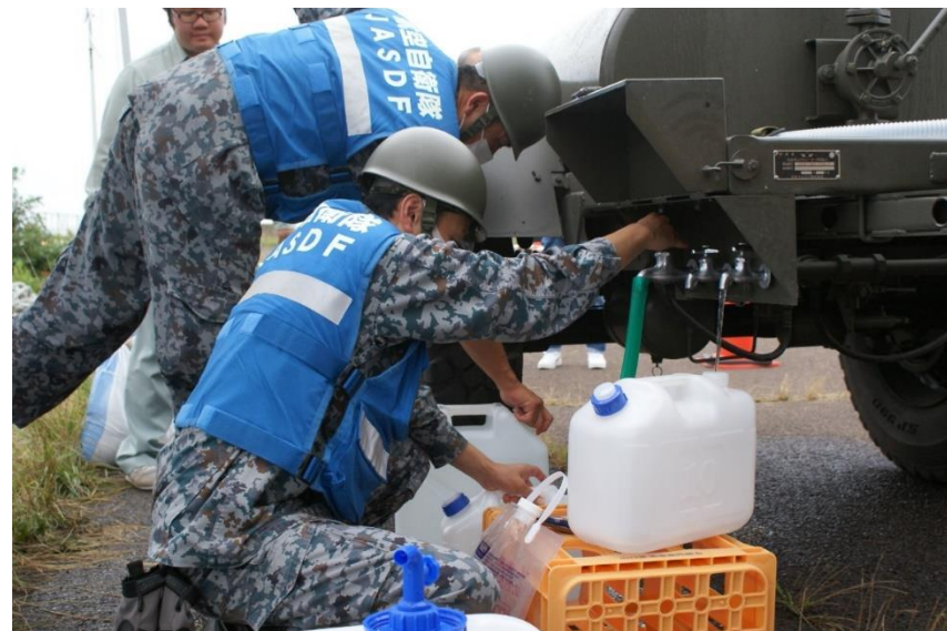
給水支援の様子（男鹿市） 【空自第33警戒隊（加茂）】