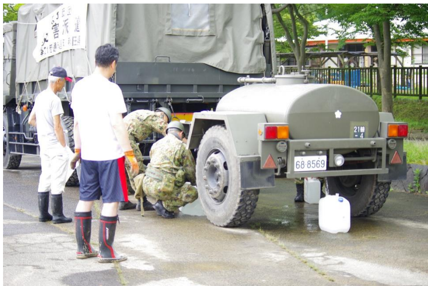
五城目町内における給水 【陸自第21普通科連隊（秋田）】