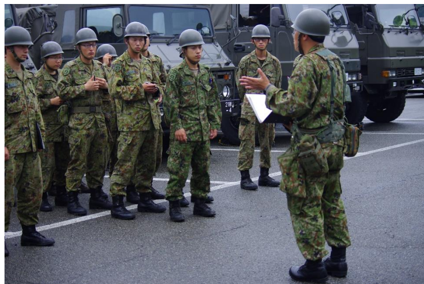
活動開始前の命令下達の様子 【陸自第21普通科連隊（秋田）】