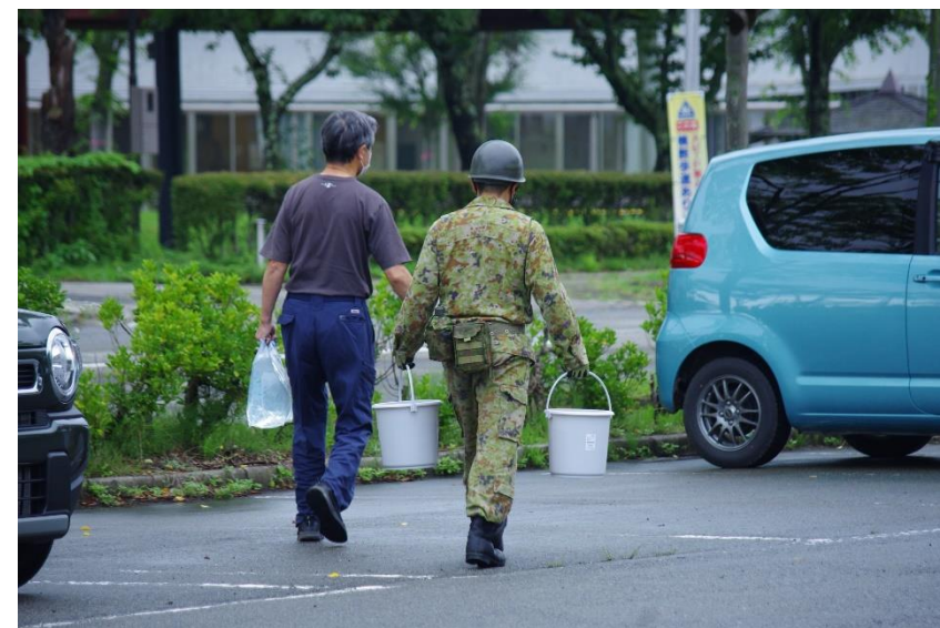
五城目町内における給水支援 【陸自第21普通科連隊（秋田）】