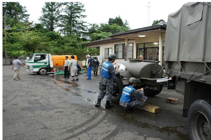
男鹿中公民館における給水支援 【空自第33警戒隊（加茂）】