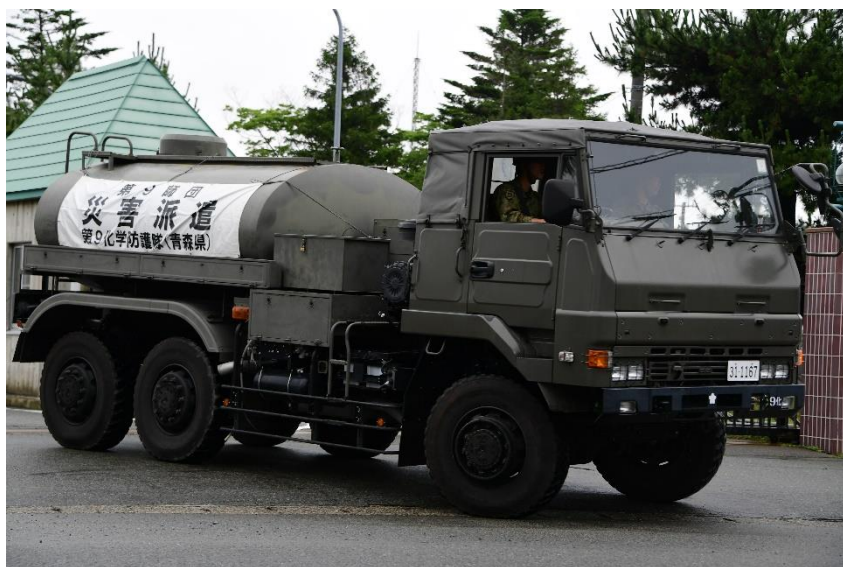
駐屯地出発の様子 【陸自第9化学防護隊（青森）】