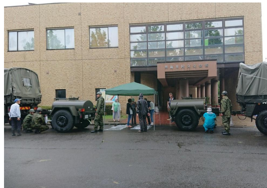
男鹿市民文化会館における給水支援 【陸自第21普通科連隊（秋田）】