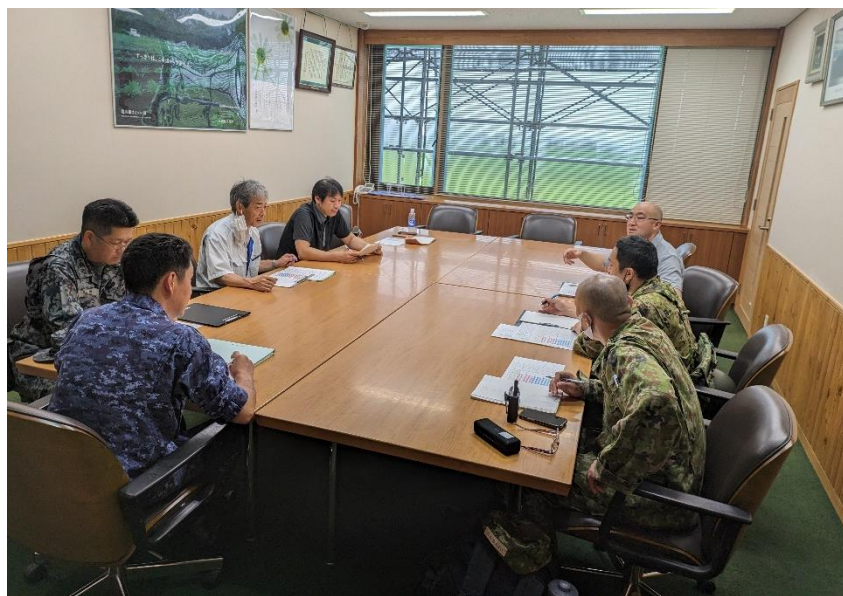
八峰町における会議の様子 【陸自第21普通科連隊（秋田）等】