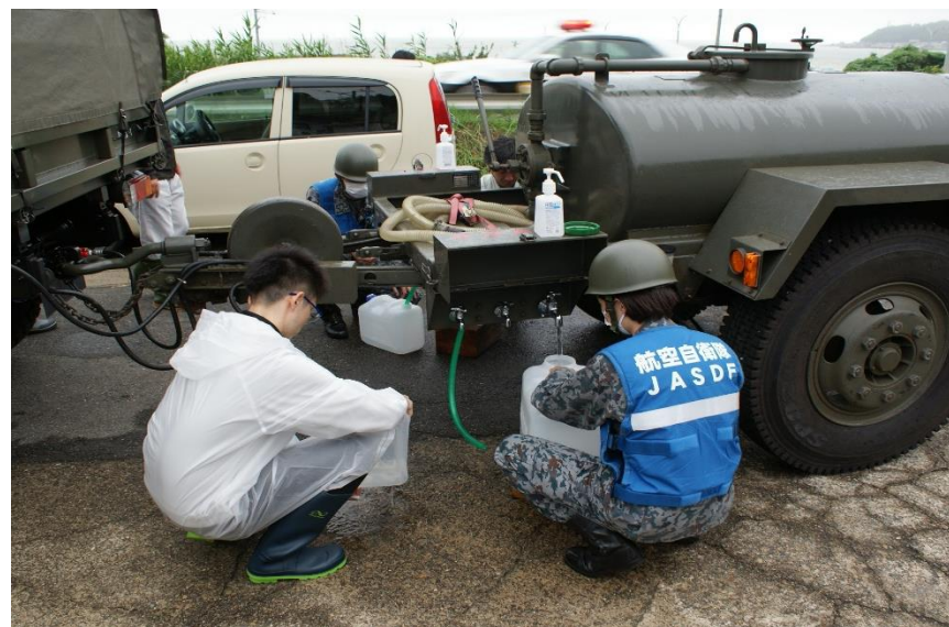
増川公民館における給水支援 【空自第33警戒隊（加茂）】