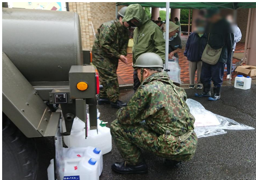
男鹿市民文化会館における給水支援の状況（秋田県男鹿市）【陸自第21普通科連隊（秋田）】