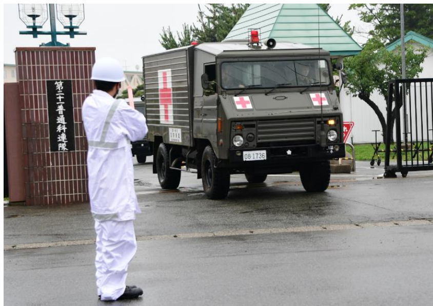
秋田市内の中通総合病院における患者緊急輸送の状況（秋田県男鹿市）【陸自第21普通科連隊（秋田）】