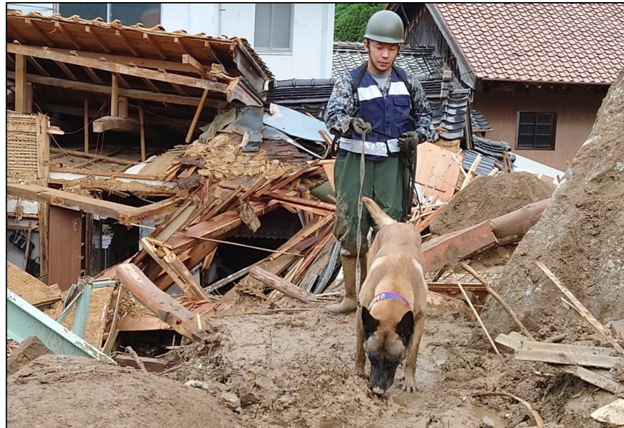
人員搜索犬による搜索活動 (佐賀県唐津市) 【空自築城基地(築城)】