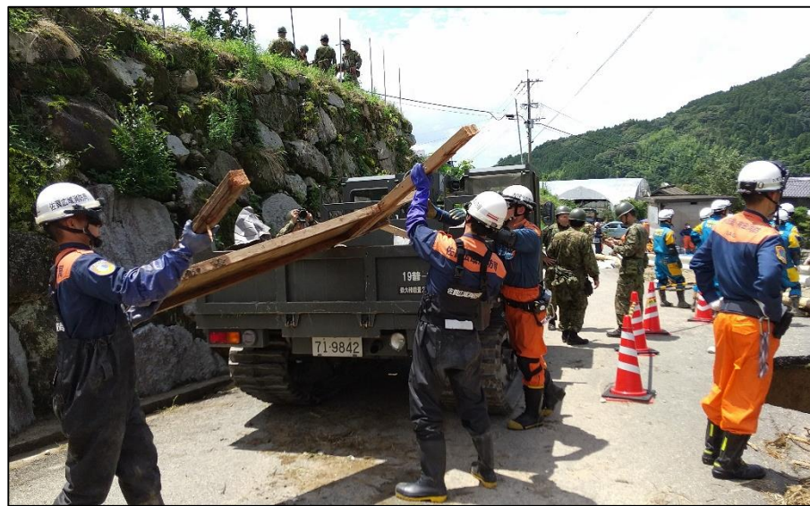
関係機関と連携し瓦礫等を除去する様子 (佐賀県唐津市) 【陸自西部方面特科連隊(久留米)】