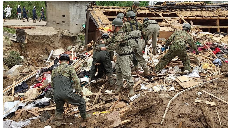
瓦礫を除去する様子 (佐賀県唐津市) 【陸自西部方面特科連隊(久留米)】