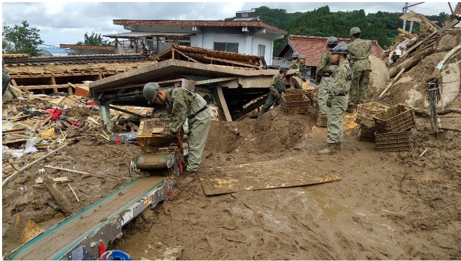
ベルトコンベアを活用し土砂を除去する様子 (佐賀県唐津市) 【陸自西部方面特科連隊(久留米)】