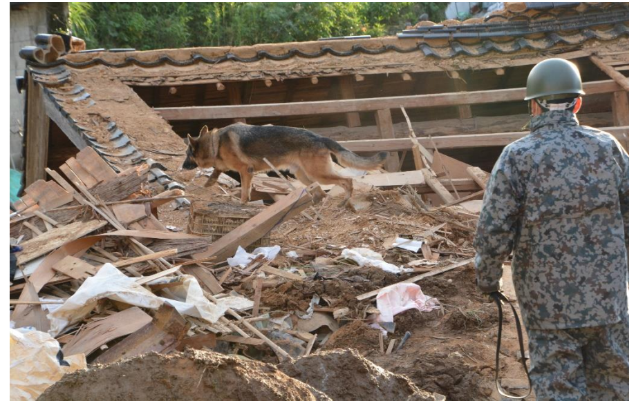
人員捜索犬の活動 (佐賀県唐津市) 【空自芦屋基地(芦屋)】