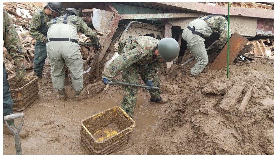
土砂崩れ現場での活動 【陸自西部方面特科連隊(久留米)】