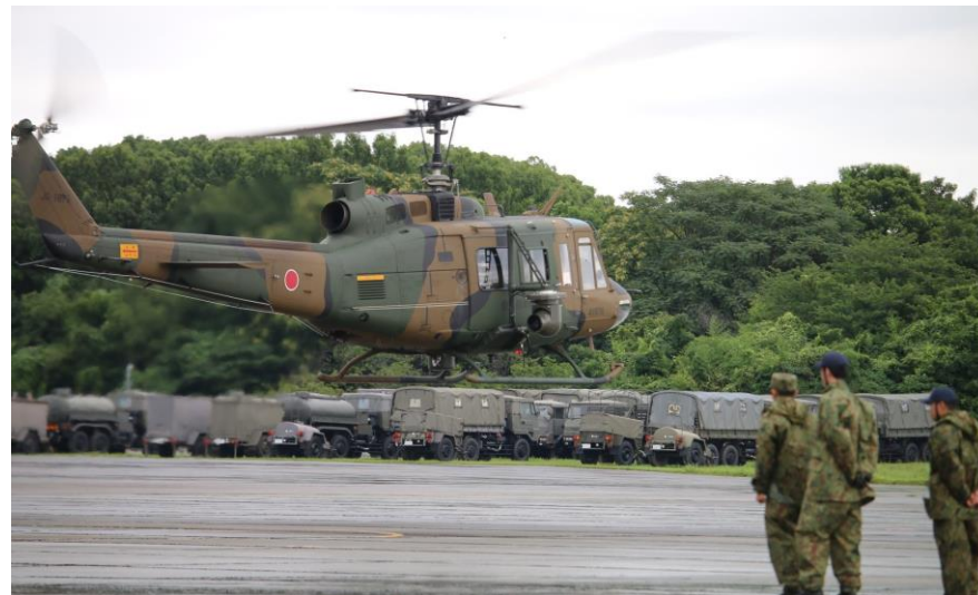
UH-1 離陸 (目達原駐屯地) 【陸自第4飛行隊(目達原)】