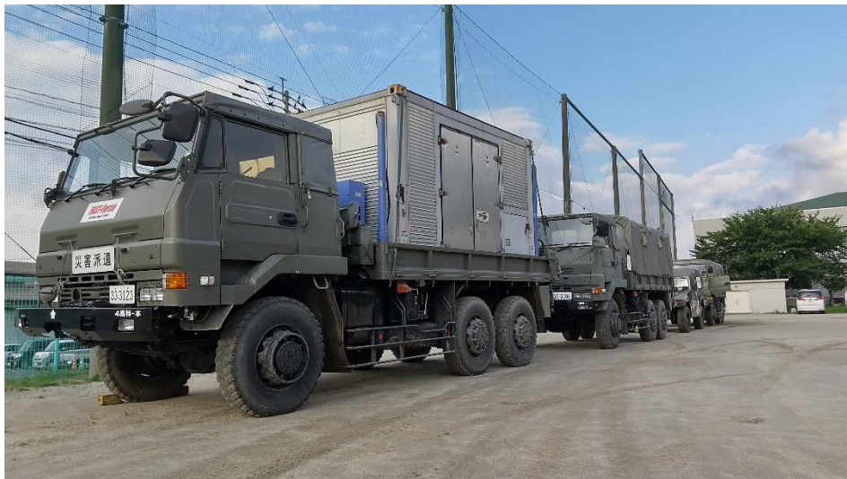
前進地点への進出 【陸自第4高射特科大隊(久留米)】