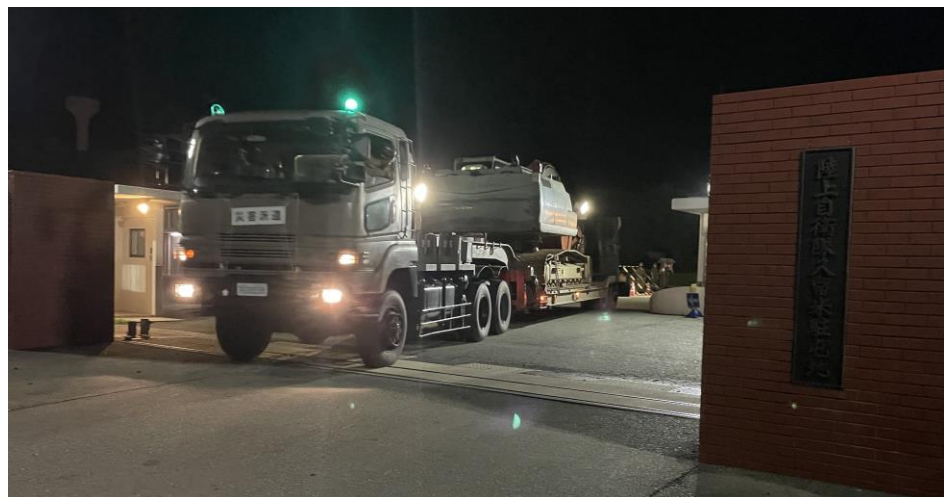
土砂崩れ現場への出発 (久留米駐屯地) 【陸自西部方面特科連隊(久留米)】