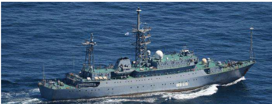
ヴィンニャ級情報収集艦（艦番号「535」）